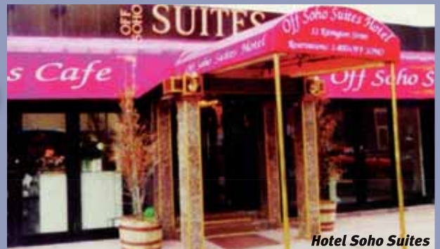
Hotel Soho Suites