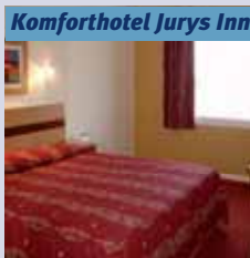
Komforthotel Jurys Inn

Die Touristenhotels verfügen über gemütliche Zimmer mit Bad bzw. Dusche/WC.