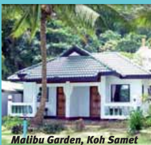
Malibu Garden, Koh Samet

Ihr übernachtet in guten bis gehobenen Mittelklasse Hotels und landestypischen Bungalowanlagen im Doppelzimmer mit Dusche oder Bad/WC. Nur die Bergübernachtung ist einfach und ohne Komfort. Einzelreisende können gegen Aufpreis ein Einzelzimmer oder ein halbes Doppelzimmer auf Anfrage buchen.