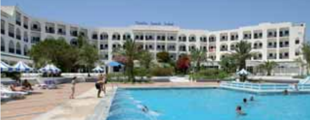
Hotel Nozha Beach

Hotel Nozha Beach: Die schöne 3* Anlage befindet sich am langen Sandstrand, das Zentrum von Hammamet liegt ca. 5 km entfernt. Diese beliebte Ferienanlage verfügt über insgesamt 350 Zimmer, die sich auf die Hotels Nozha Beach und das etwas zurückversetzte Schwesterhotel Royal Nozha verteilen. Sie bietet Rezeption (Mietsafe), Lobby, Lift, Buffet- und à la carte-Restaurant, Bar, Snackbar, Maurisches Café, Diskothek, Aufenthaltsraum mit SAT-TV, Kiosk und Frisör. In der weitläufigen Außenanlage befinden sich 2 Süßwasser-Swimmingpools mit Liegeterrasse. Die Zimmer sind freundlich eingerichtet mit Du/WC, Telefon, SAT-TV, Klimaanlage sowie Balkon/Terrasse. Für die Sportbegeisterten gibt es Tennisplatz, Volleyball, Tischtennis, Darts, Bogenschießen und Aerobic. Euer All Inclusive bietet euch Vollpension in Buffetform, Snacks, Erfrischungsgetränke und lokale Alkoholika von 10.00-24.00 Uhr.