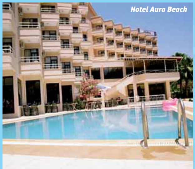
Hotel Aura Beach

8 Tage schon für 389,- zzgl. 34,- Euro Abflughafenzuschlag